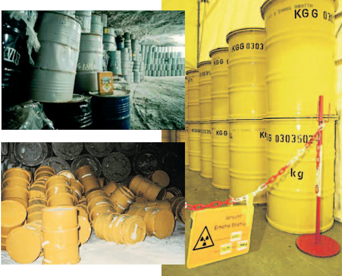
Atommüll im Salzstock Asse II und Lager Morsleben

In Wirklichkeit ist bisher kein Gramm hochradioaktiven Atommülls sicher und dauerhaft entsorgt worden. Eine Endlagerstätte müsste den sicheren Einschluss des Mülls für mindestens eine Million Jahre sicherstellen.