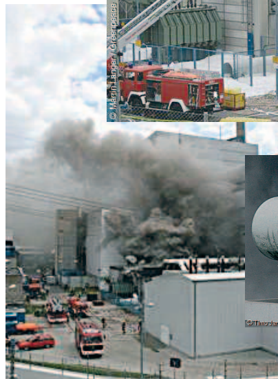
Brand im Kernkraftwerk Krümmel, Sommer 2007